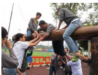
「律己互勉」領袖訓練計劃